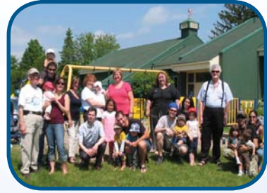
Un enfant un arbre Plantation d'arbres à l'hôtel de ville