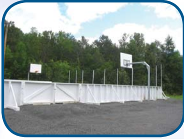
Installation de deux paniers de basketball à la Gare de Piedmont