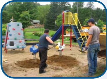
Nouveautés au Parc de l'hôtel de ville