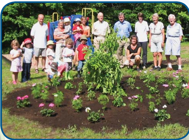
Création d'un jardin de fleurs au Parc des Bois-Blancs